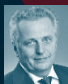
Rudolf Hundstorfer Sozialminister